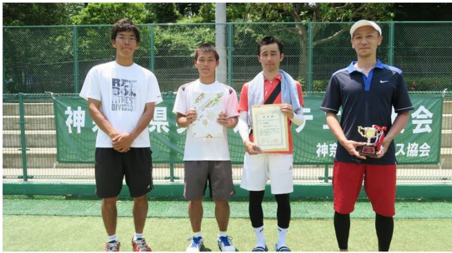
男子準優勝 座間市役所 (座間市)