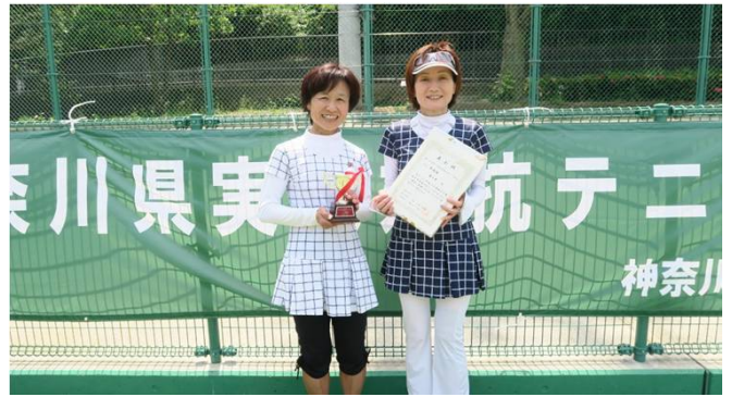
女子準優勝 味の素 (川崎市)