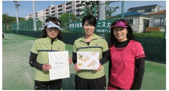
女子三位 藤沢市役所 (藤沢市)