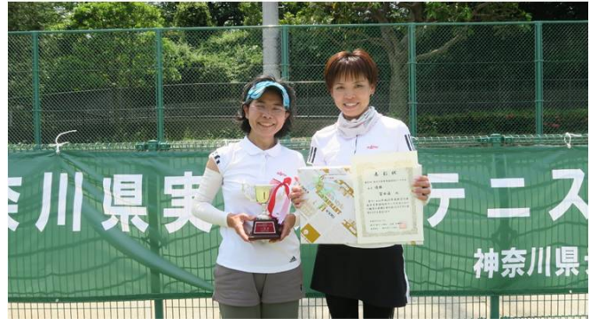
女子優勝 富士通 (川崎市)