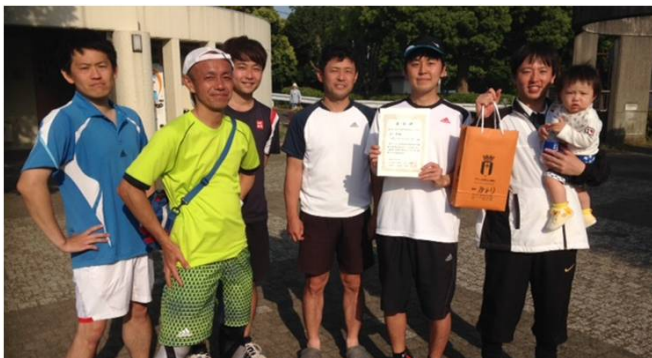
男子三位 NECソリューションイノベータ (横浜市)