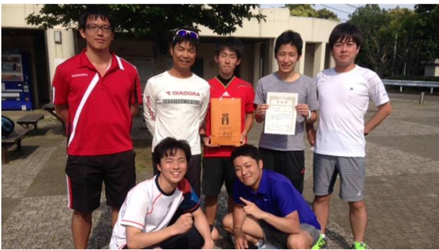
男子三位 日立ソリューションズ(B) (横浜市)