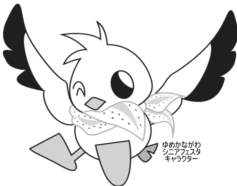
ゆめかながわ シニアフェスタ キャラクター